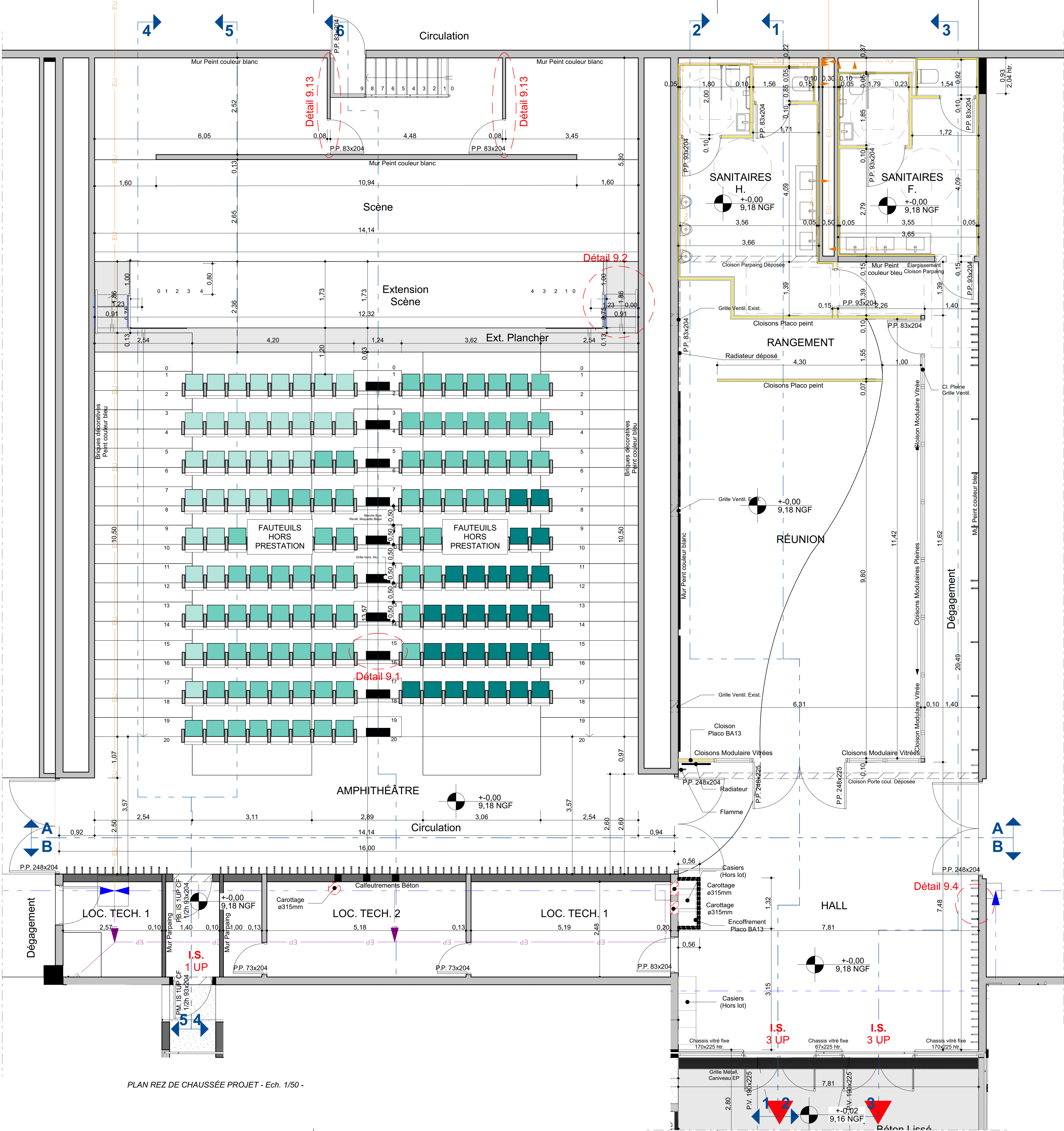
PLAN REZ DE CHAUSÉE PROJET - Ech. 1/50 -